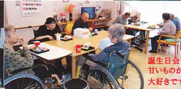
誕生日会 甘いものが 大好きです!!