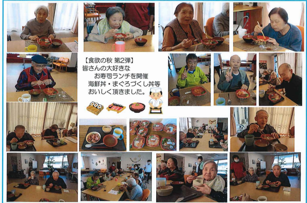
【食欲の秋 第2弾】 皆さんの大好きな お寿司ランチを開催 海鮮丼・まぐろづくし丼等 おいしく頂きました。

先日、デイサービスの花壇にお邪魔しました。ハンジーやハボタン・手作りのペイントールがあり、とても素敵な花壇でした。入居者様は口々に「黄色が好き」「見事な花壇だ」とお話しされていました。やっぱりお花はいいですね。現在当施設において、中庭のリフォームを検討しています。皆様が寛げる空間にするには？ 季節のお花を植えようか？ など。ご希望を伺いながら、進めていきたいと思います。