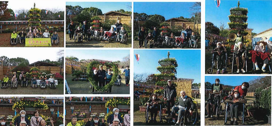
古河・菊まつりに行ってきました。 お天気に恵まれて、とても気持ちのいい ドライブ観光となりました。