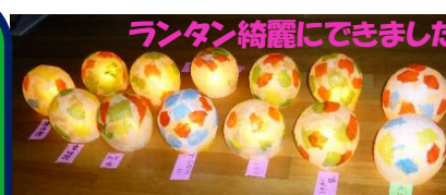
ランタン綺麗にできました

10月は、道の駅にお買物に行きました。皆様それぞれにお買物を楽しまれていました。また、ランタン作りでは、小さい風船に障子紙を貼る作業に苦戦されている様子でしたが、出来上がった作品はとてもきれいで素敵でした!