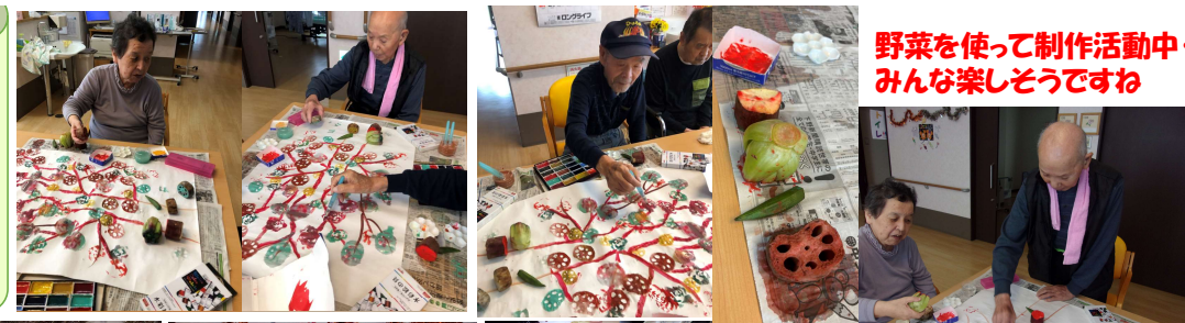
野菜を使って制作活動中・みんな楽しそうですね

晩秋の気配を感じる今日この頃皆さまいかがお過ごしでしょうか。インフルエンザの流行期に入ったようです。入居者様は10月28日に予防接種を行いました。加湿器の準備を進めております。室内温度の調整、衣服の調整等行い体調の変化に注意し支援させていただきます。