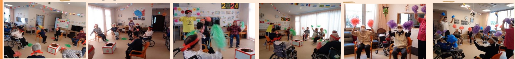
まずはみんなで体操