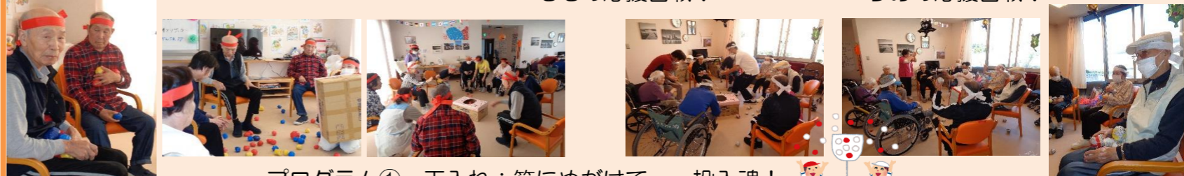
プログラム① 玉入れ：箱にめがけて…投入魂!