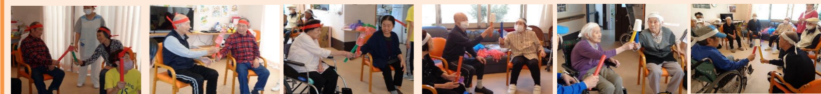
プログラム② バトンリレー：コップバトン 落とさずゴールへ!