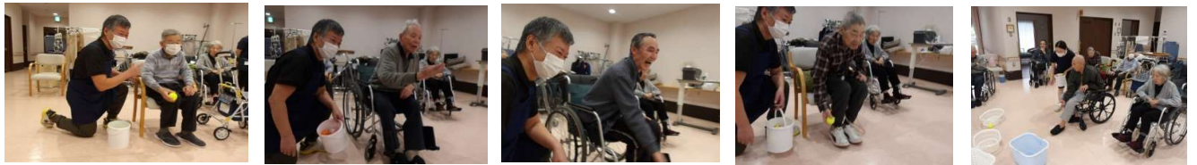
玉入れ沢山入ったかな？

また、感染症(インフルエンザ・コロナ・マイコプラズマ等)の流行に備え、面会の方法を検討しております。決まりましたらご連絡いたしますので、その際にはご理解・ご協力の程お願いいたします。