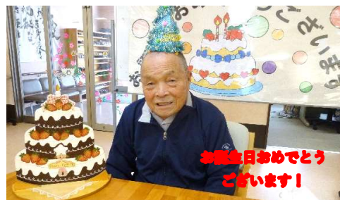
お誕生日おめでとう ございます!