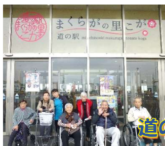
道の駅に行きました!