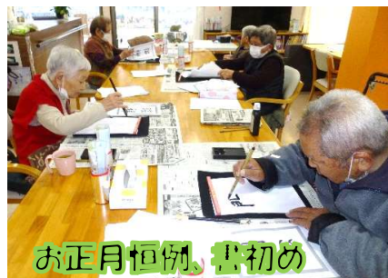
お正月恒例、書初め

春にむけ、外出の機会も増える事と思います、デイサービスで楽しく体を動かし、足腰の筋力維持に努めていきましょう！