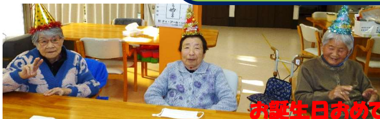
お誕生日おめでとうございます！