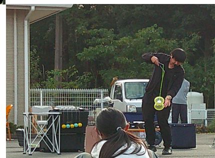
大道芸ボランティア 大変盛り上がりました。